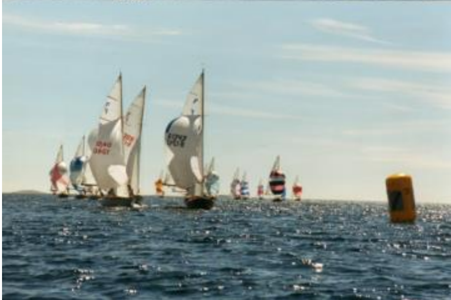
Folbåts SM år 1987