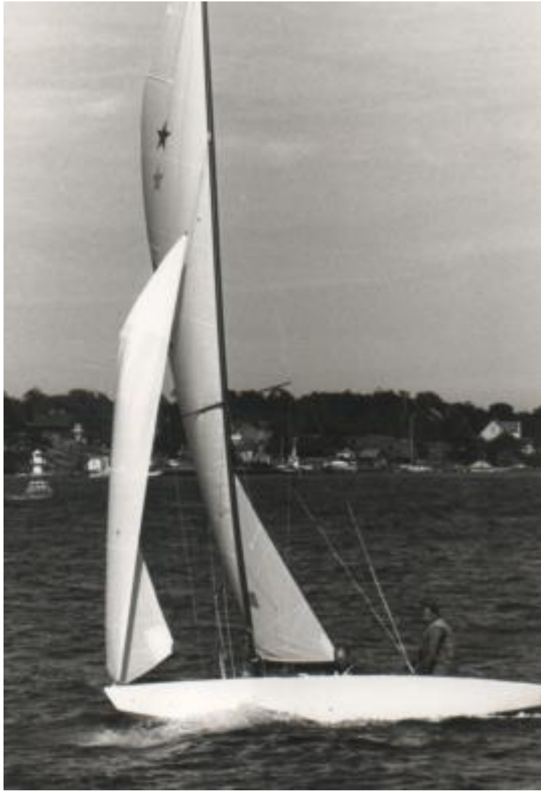
Starbåtssegling år 1980