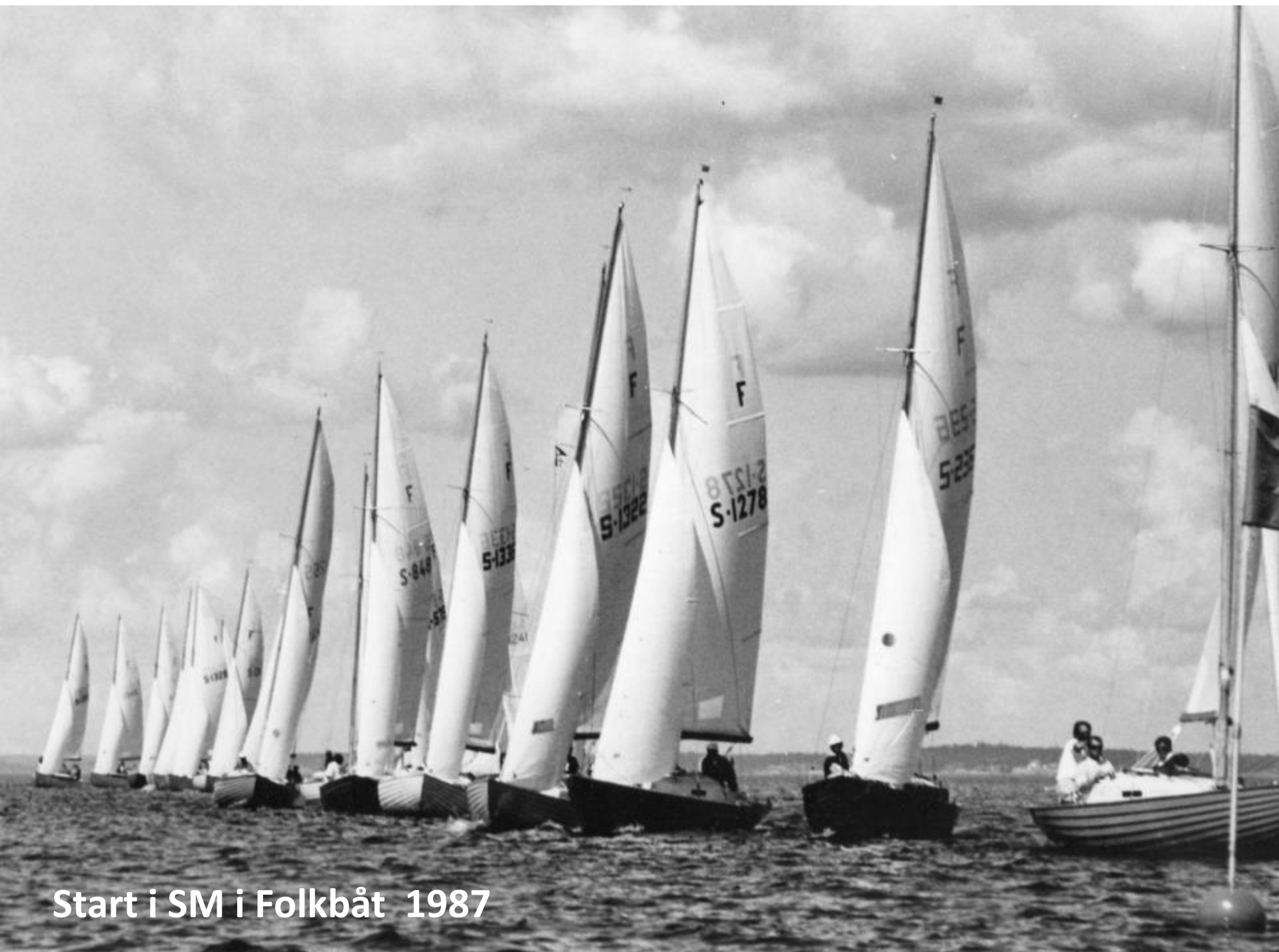
Start i SM i Folkbåt 1987