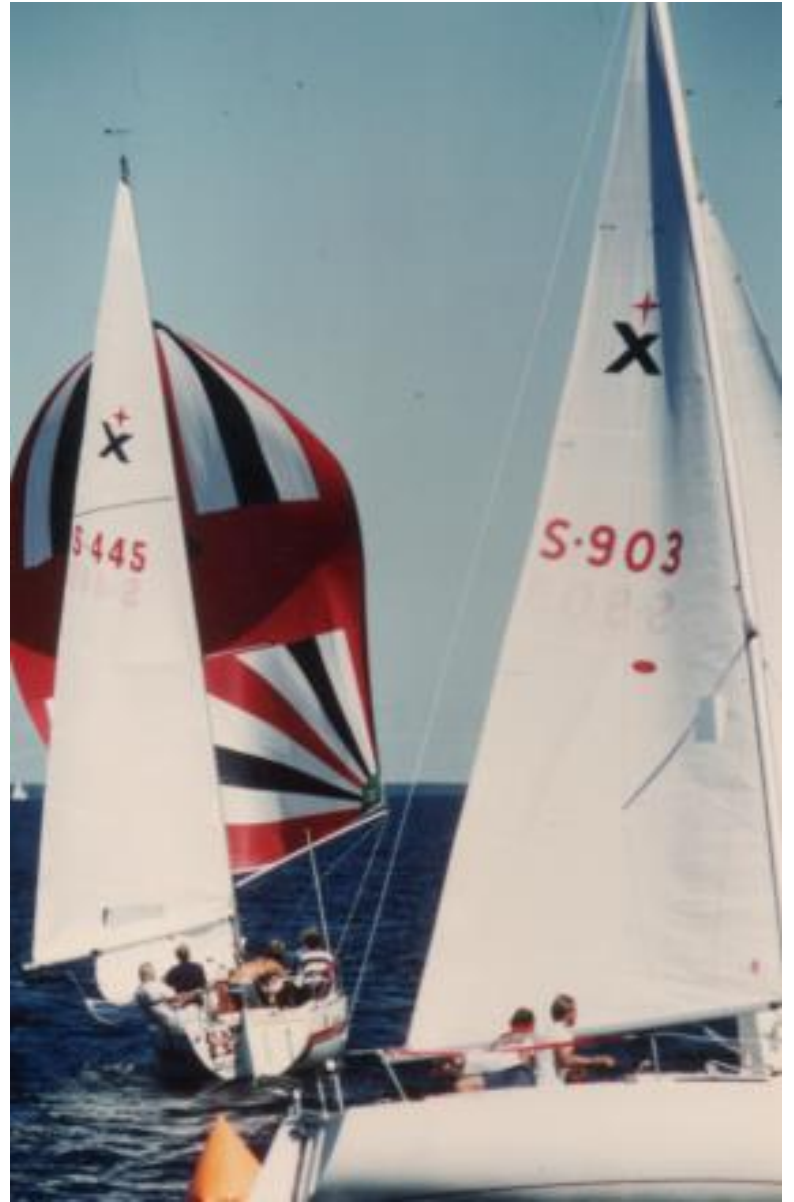
Express SM år 1982, Express S445 Thomas Björklund