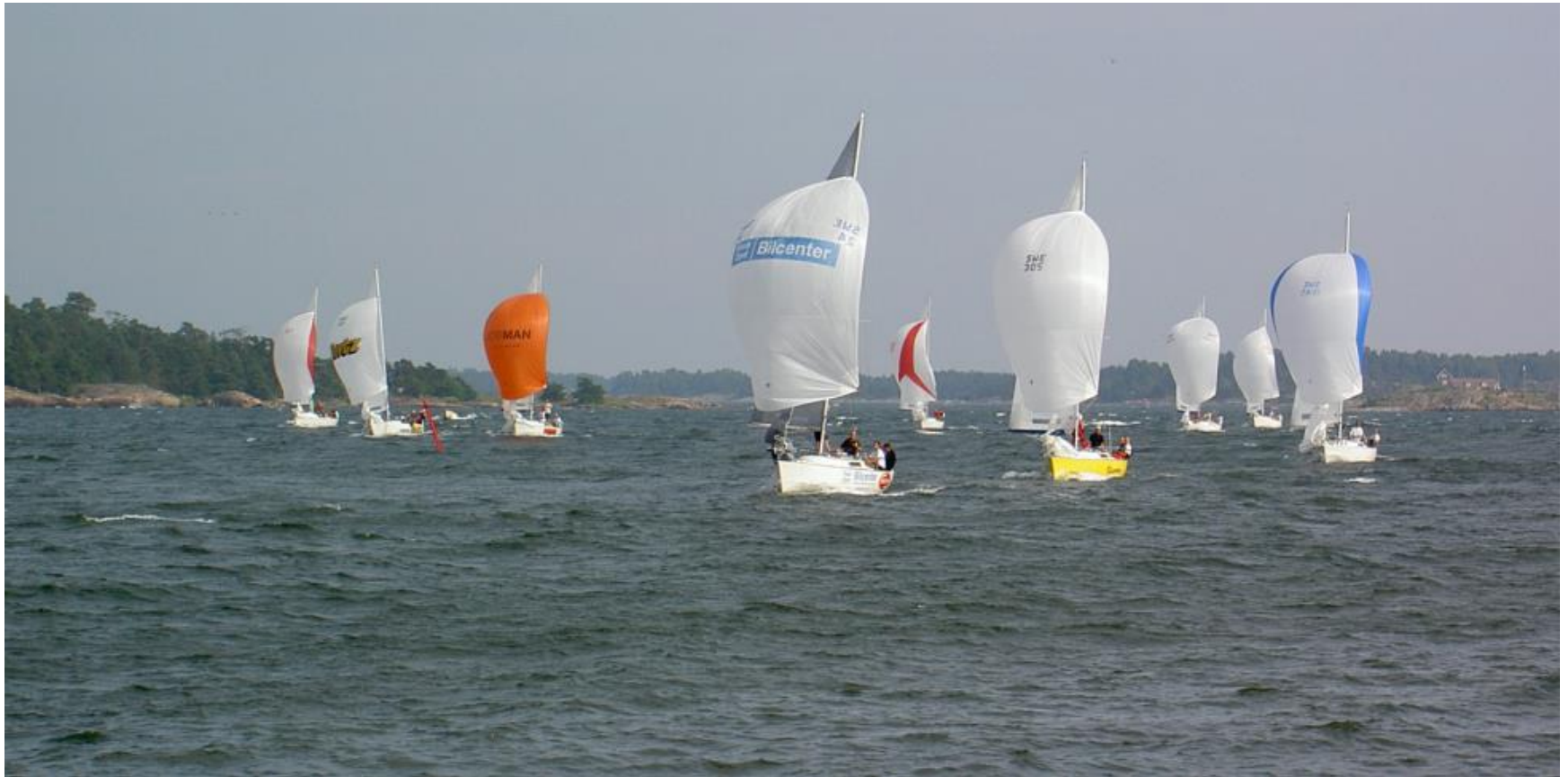
Turn-up Express SM 2006