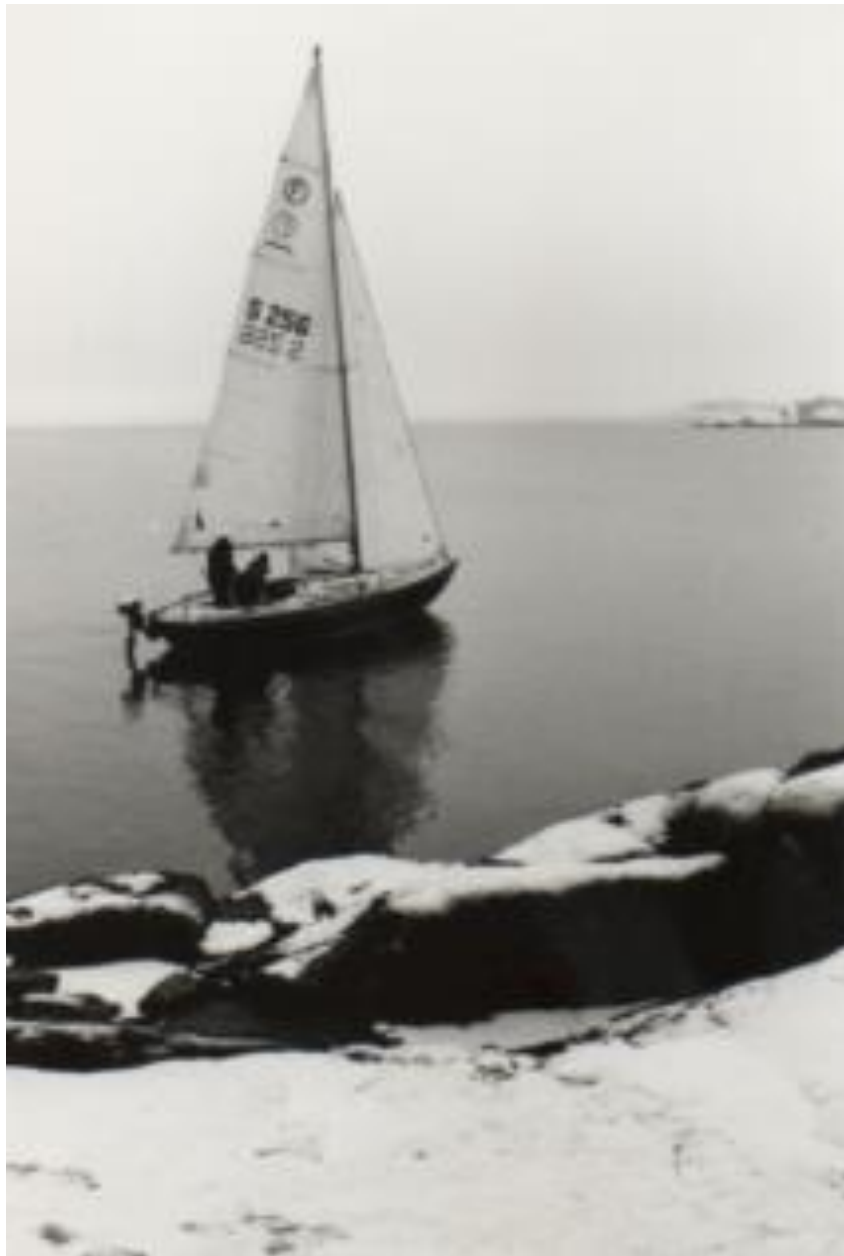
Stig Liden tränar lättvind en tidig vår år 1993