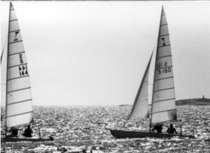
SM i OS-klasser 1982